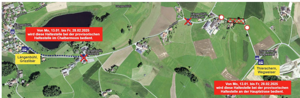
Übersicht prov. Haltestellen STI